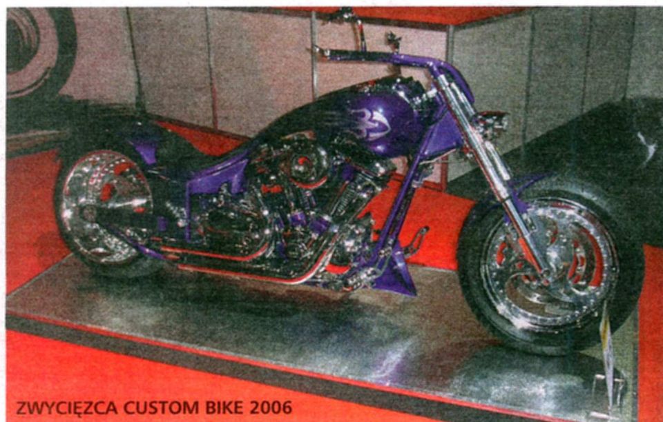
ZWYCIĘZCA CUSTOM BIKE 2006